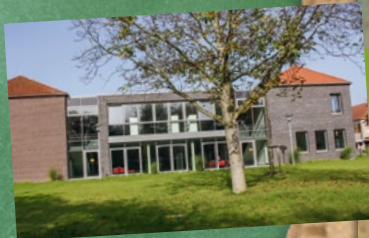
Standort: Ennigerloh, Berliner Straße

Berliner Straße 37 (Jg. 8–10, gymnasiale Oberstufe) 59320 Ennigerloh Telefon: 02524 929560