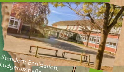
Standort: Ennigerloh, Ludgerusstraße